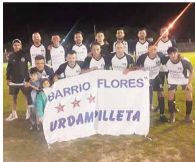
Barrio Flores, de Urdampilleta, es el último campeón pero no participará en esta edición.