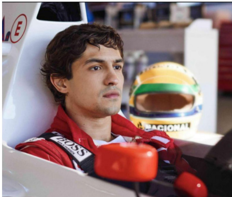
Imagen de promoción de la serie “Senna”, que estrenó Netflix el viernes 29 de noviembre.