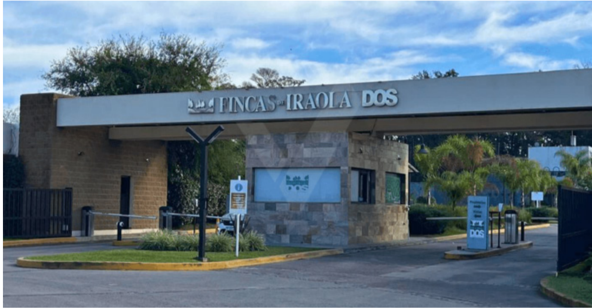
Conmoción por el ataque de un adolescente de 16 años a toda su familia.

La mujer fue trasladada de urgencia al hospital, donde perma-