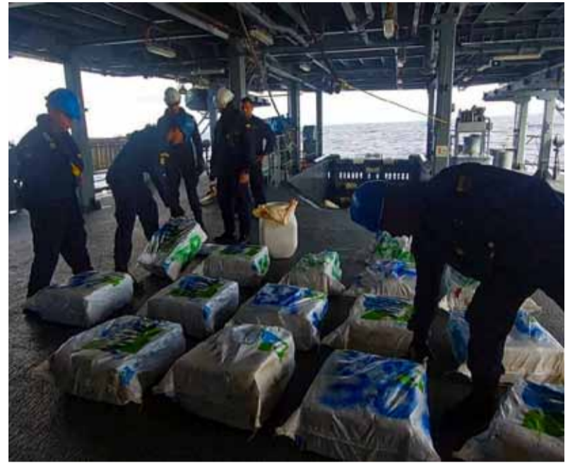
Megaoperativo Orión.

De otro lado se capturaron 434 miembros de grupos ilegales de diferentes nacionalidades a través