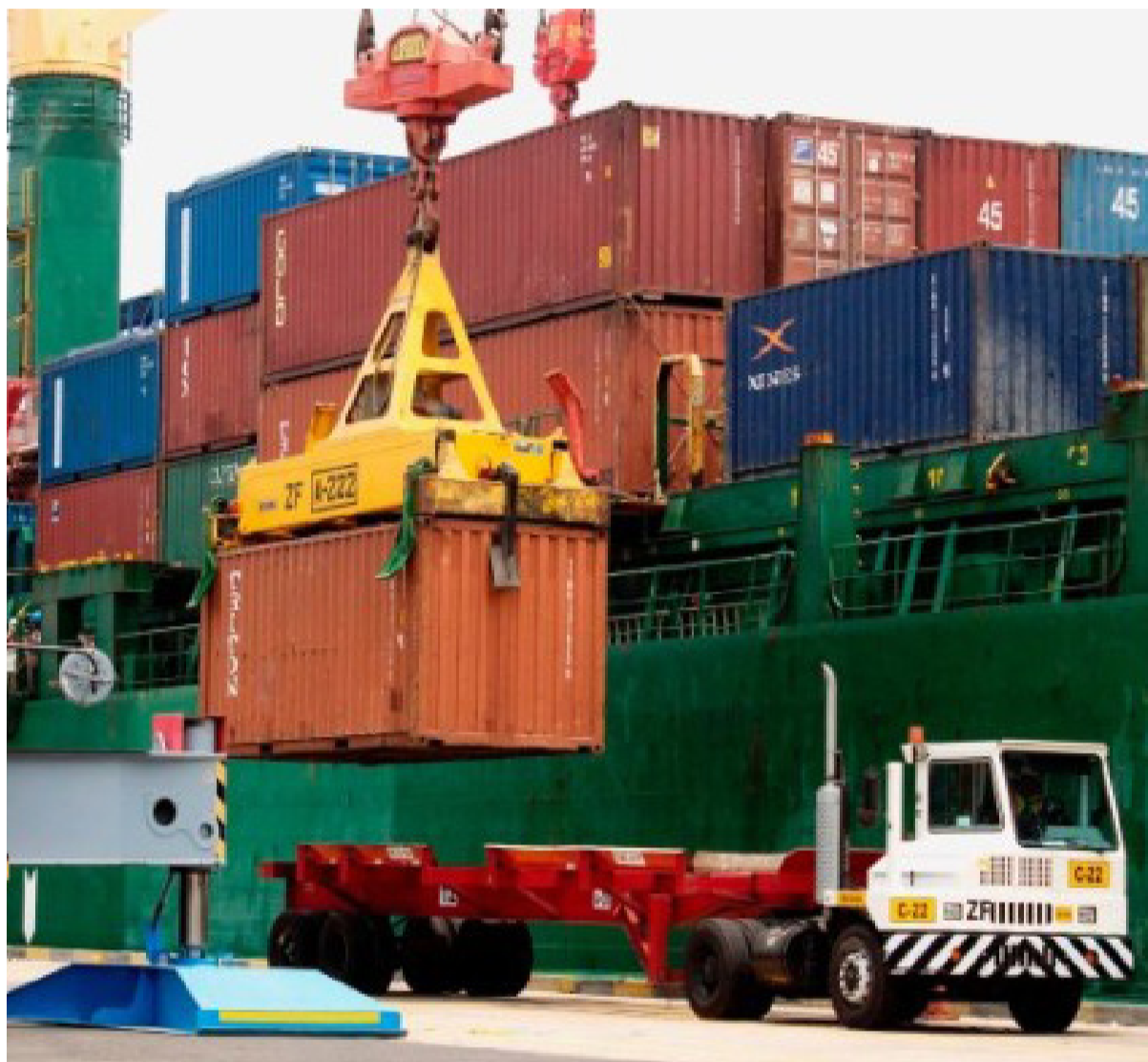
El Monitor de Exportación Pyme (MEP) es un indicador elaborado por el sector de Estadísticas e Informes de CAME.

En octubre se registró una suba interanual de US$ 1.990,3 millones en el total exportado y de 1,3 millones de toneladas en el volumen comercializado, de acuerdo con CAME.